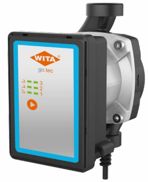
go.tec G Geothermal