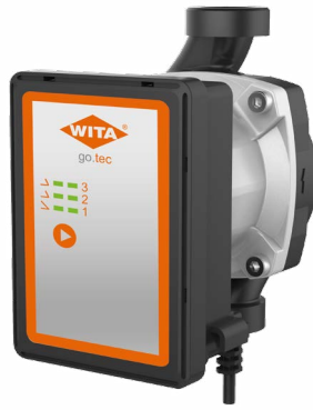
go.tec H Heating