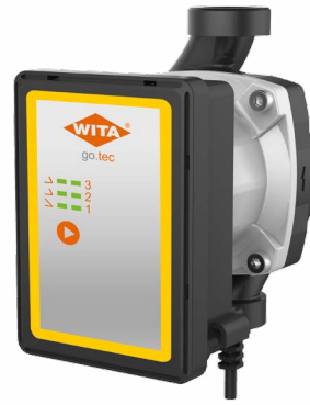
go.tec S Solar