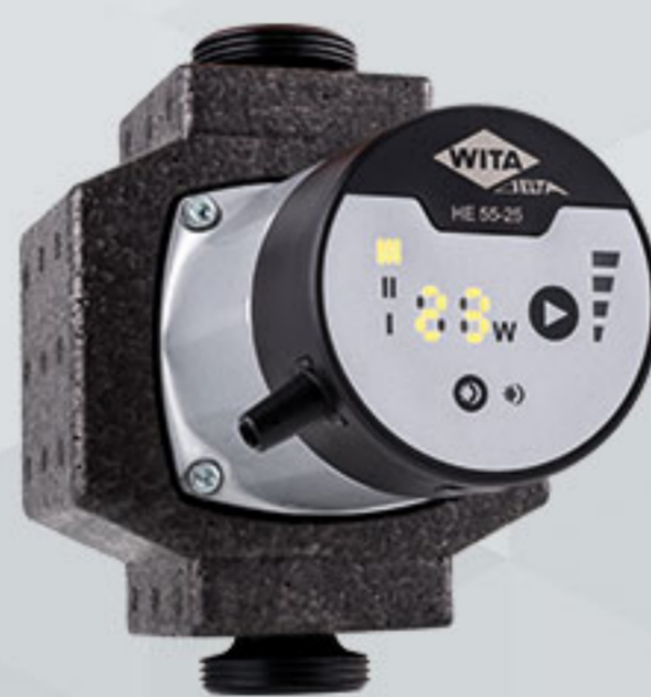
WITA Delta HE 55 | HE 35