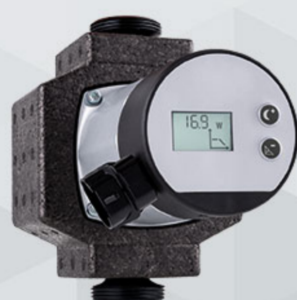
WITA Delta HE 35 LCD | HE 55 LCD

Durch kompromisslose hohe Qualitätsstandards, gepaart mit den zahlreichen Anwendungsmöglichkeiten unserer Pumpen, sind wir in der Lage, unseren Kunden für nahezu jeden Anwendungsbereich eine optimale Lösung anbieten zu können. Einsatz finden unsere Hocheffizienzpumpen in den Bereichen Heizungs-, Trinkwasser- und Solartechnik. Tagtäglich arbeitet die Forschungs- und Entwicklungsabteilung an neuen innovativen Lösungen, um dem Fachhandwerk auch in Zukunft den Alltag zu erleichtern.