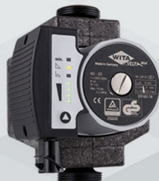
WITA Delta MIDI 40 | MIDI 60