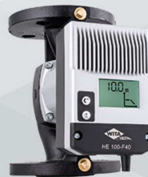
WITA Delta HE 75 | HE 100 F | HE 120 F