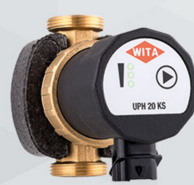
WITA UPH 20-KS